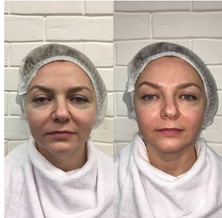
Patientin, 48 Jahre alt, vor und nach einer Behandlung mit transbuccaler Gesichtsmassage.